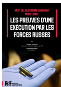
Photo de couverture : Balle retrouvée dans le sol à l'endroit où se trouvait le corps de Maks Levin lors d'une recherche initiée par RSF le 30/05/2022 dans la forêt près de Huta-Mezhyhirs'ka au nord de Kyiv, Ukraine.