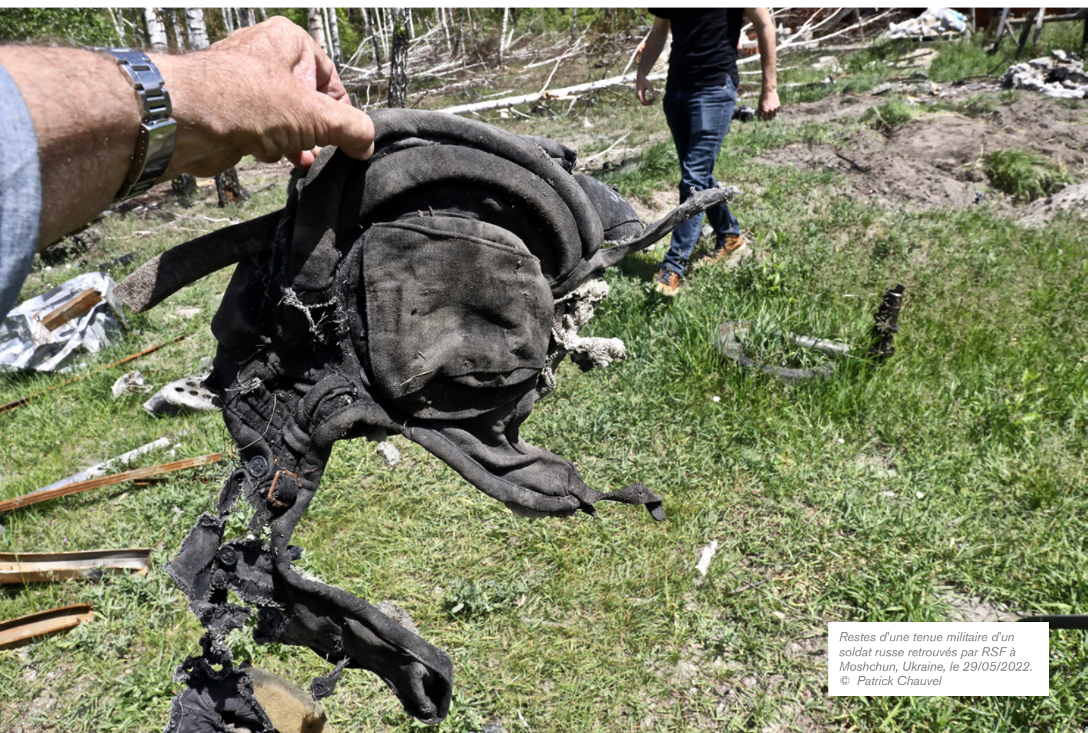
Restes d'une tenue militaire d'un soldat russe retrouvés par RSF à Moshchun, Ukraine, le 29/05/2022.