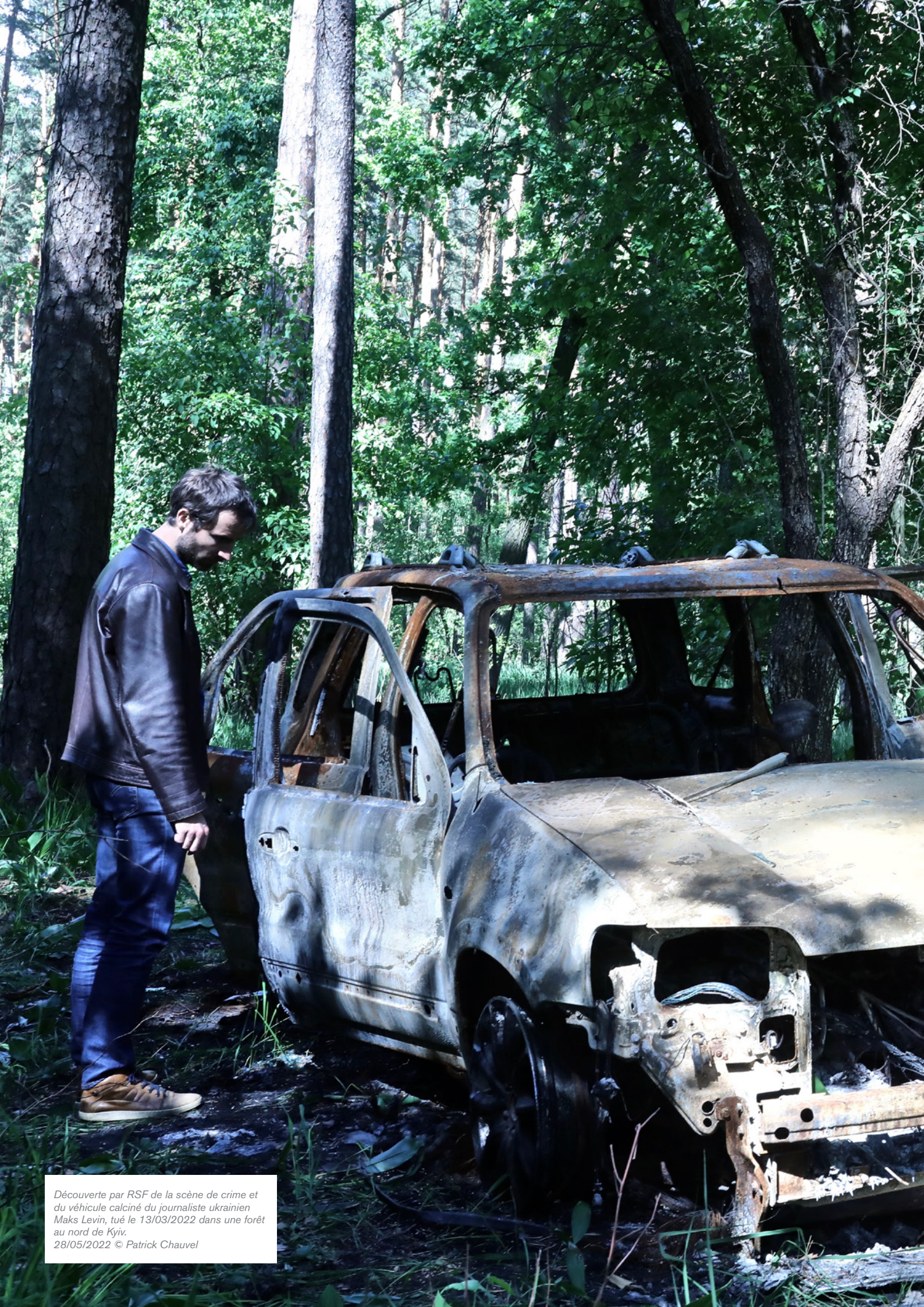
Découverte par RSF de la scène de crime et du véhicule calciné du journaliste ukrainien Maks Levin, tué le 13/03/2022 dans une forêt au nord de Kyïv. 28/05/2022