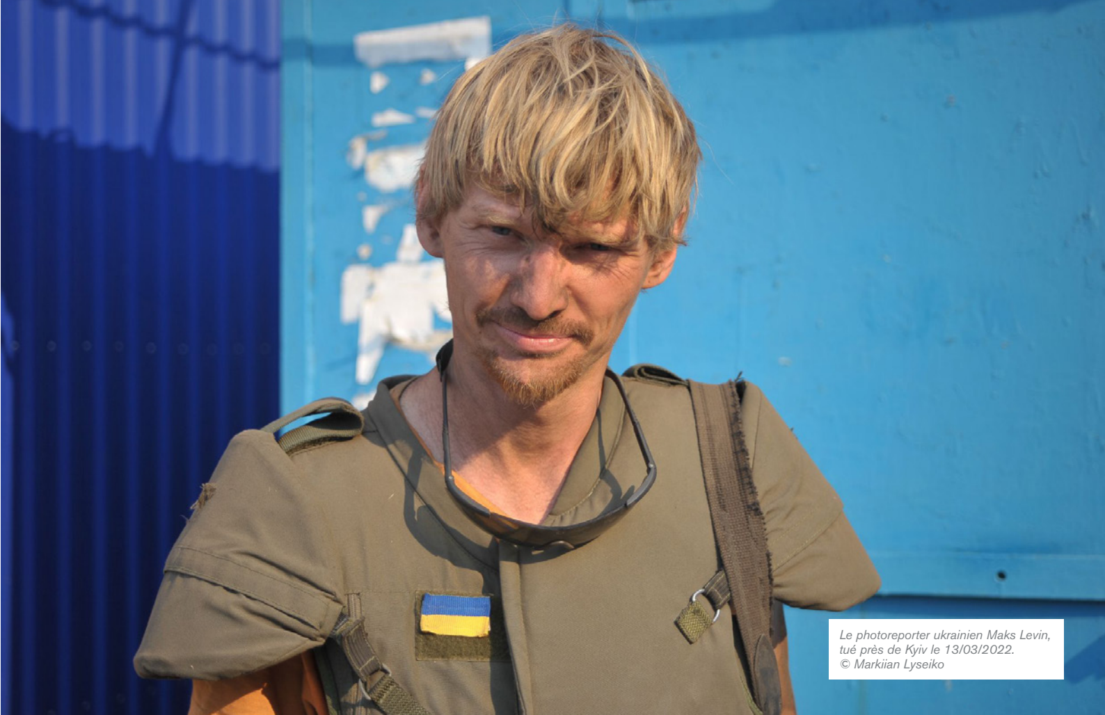
Le photoreporter ukrainien Maks Levin, tué près de Kyiv le 13/03/2022.