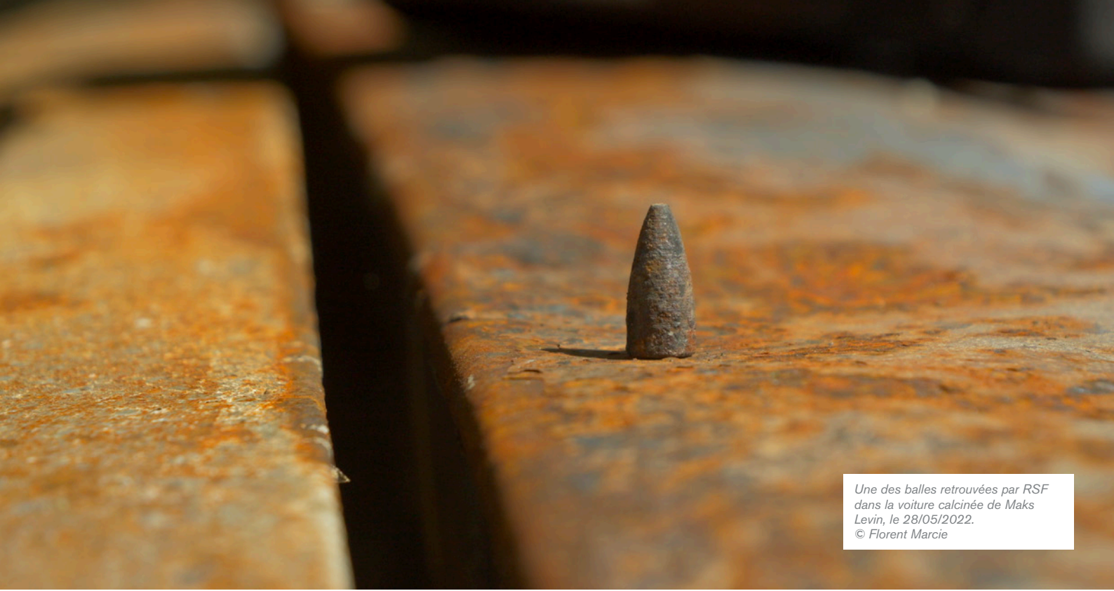
Une des balles retrouvées par RSF dans la voiture calcinée de Maks Levin, le 28/05/2022.

Après trois heures de recherches effectuées à partir du dernier point GPS de la voiture du journaliste, cette première visite ne permet pas de localiser la scène de crime. Deux jours plus tard, le 28 mai 2022, une nouvelle tentative permet cette fois d'arriver sur les lieux. Voici ce qu'il ressort de nos observations :