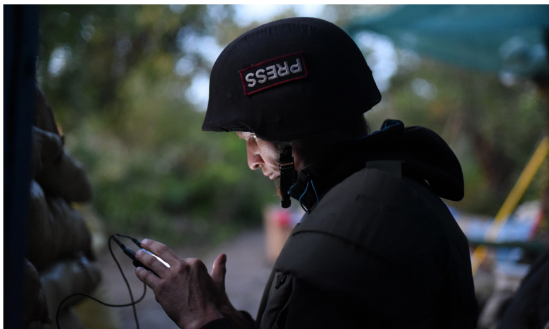
Le journaliste Maks Levin

Les éléments constitutifs de ce rapport ont été collectés dans le cadre d'une mission d'enquête de Reporters sans frontières (RSF) en Ukraine du 24 mai au 3 juin 2022. L'organisation a rassemblé et transmis des éléments de preuve à la justice ukrainienne, qui font l'objet de ce rapport récapitulatif qui sera à son tour transmis. Les investigations ont permis de mettre au jour des éléments indiquant que le photoreporter et son accompagnateur ont été froidement exécutés, après avoir été probablement interrogés et torturés par les forces russes le jour de leur disparition, le 13 mars 2022. Les corps et la voiture du journaliste avaient été retrouvés dans une forêt située sur la ligne de front au nord de Kyiv le 1 er avril.