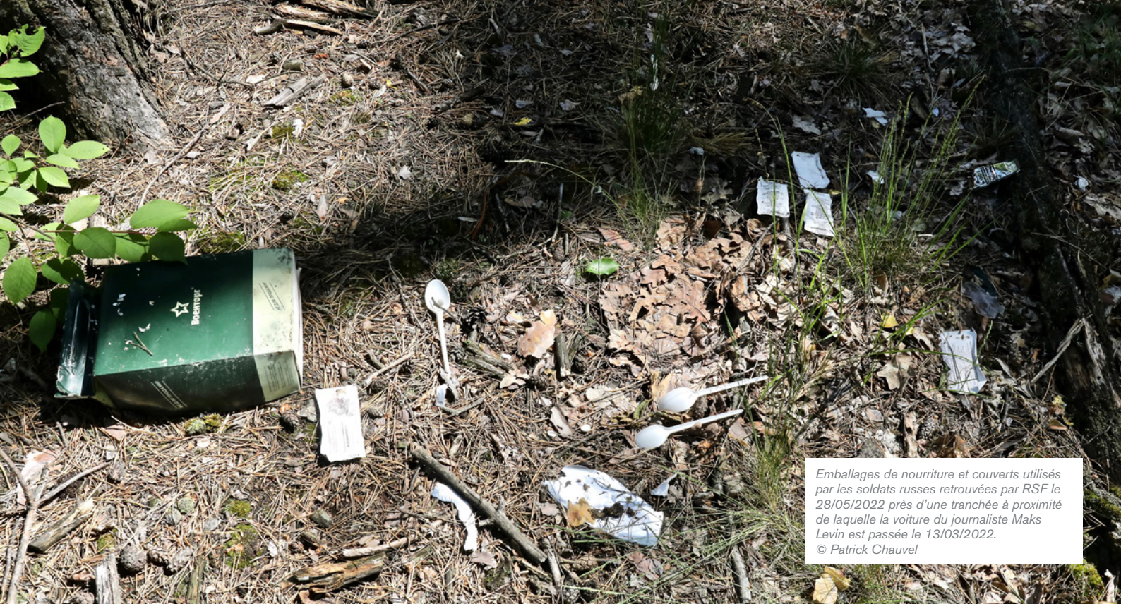
Emballages de nourriture et couverts utilisés par les soldats russes retrouvés par RSF le 28/05/2022 près d'une tranchée à proximité de laquelle la voiture du journaliste Maks Levin est passée le 13/03/2022.